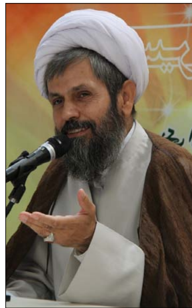
نویسنده: آیت الله مهدی احدی

از چند جهت شباهت دیده‌ام: اول: گوساله سامر، از مواد شیمیایی به صدا درآمد و گوساله‌ی زنده و حقیقی نبوده است، صیحه‌ای می‌زد، چون «خوار» مثل: صاهل است. عده‌ای فریب خوردند، و خدای زنده را رها کردند و گوساله پرست شدند. آیا شبکه بی بی سی و بسیاری از شبکه‌های دنیا، با ترکیب مواد شیمیایی تصویر و صدای افراد را منتشر نمی‌کنند؟ چه فرقی با گوساله‌ی سامری دارد؟ سؤال: فرقی این است که افراد زنده در این شبکه‌ها سخن می‌گویند، با منطق و استدلال بحث می‌کنند، ولی گوساله سامری، صدایی بیش نبوده است، منطق